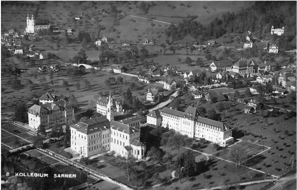
ABB. 5: Eine Luftbildaufnahme zeigt das Gelände der Kantonalen Lehranstalt Sarnen um circa 1939. Links das Konviktsgebäude, im Vordergrund mittig das 1891 eingeweihte Alte Gymnasium und rechts das Professorenheim aus dem Jahr 1928/29.

und Urkundenlehre ein. 8 Briefe seines Vaters zeugen davon, dass seine Eltern den gewählten Lebensweg ihres Sohnes unterstützten: «O, lieber Xaver, durch dein anächtiges, anhaltendes, für uns dargebrachtes Gebet u. deinen braven Lebenswandel fühlen wir uns ja reichlich belohnt.» 9 1897 legte er Profess ab 10 und erhielt den im Kloster bis dahin noch nie gewählten Namen Emmanuel. 1899 folgte die Priesterweihe, bevor er in Innsbruck und später in Freiburg i. Ü. Naturgeschichte und Germanistik studierte und mit der Dissertation «Gefässbündeltypen und Gefässformen» im Bereich der Botanik abschloss. 11