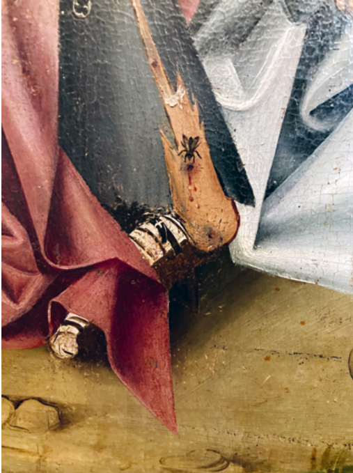
ABB. 13: Dreikönigsaltar: Auf dem Beinstumpf des Bettlers, dem Martin einen Teil seines Mantels gab, sitzt eine übergrosse Fliege. Solche realistischen Details finden sich an verschiedenen Stellen auf dem Retabel.

sche Fassung des Themas existierte, die immer wieder aufgenommen wurde. 26 Der Zugehörigkeit zum Dreikönigsaltar steht deshalb aus Datierungsgründen nichts im Wege. Trotz leicht abweichendem Stil verbinden auch technische Merkmale die Predella sehr eng mit der Werkstatt des Dreikönigsaltars. Es ist nicht aussergewöhnlich, dass die Predella als Arbeit von Gehilfen qualitätsmässig gegenüber der Malerei eines Retabels etwas abfällt (siehe unten).