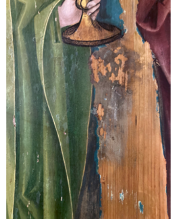
ABB. 17: Noch heute ist auf dem Dreikönigsbild am oberen Rand der Rest des originalen Goldgrundes zu sehen. Die Rekonstruktion von 1975 nimmt das Muster des Marienaltars auf.