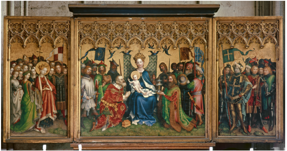
ABB. 9: Auch der Kölner Maler Stefan Lochner wählte 1445 die Dreikönigsszene zu seinem Hauptbild. Die seitlichen Heiligen nehmen an der Huldigung symbolisch teil (Köln, Wallraf-Richartz-Museum, Inv.-Nr. WRM 66).