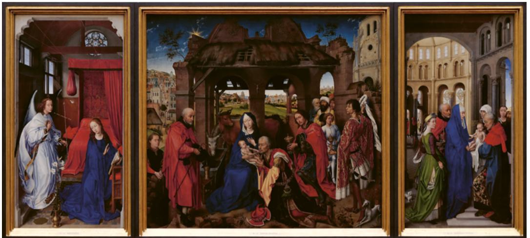
ABB. 10: Wohl rund zehn Jahre später entstand die Anbetung der Könige von Rogier van der Weyden für die Marienkapelle der Pfarrkirche St. Kolumba in Köln. Diese Version hat die Malerei der Zeit stark geprägt (Columba-Altar, München, Alte Pinakothek, WAF 1191).