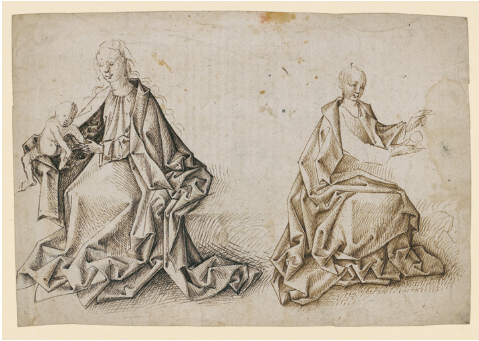
ABB. 25: Oberrheinische Federzeichnung im Kupferstichkabinett Basel, um 1470, mit ähnlichen Draperien, die zwar kunstvoll, aber etwas unnatürlich gefaltet sind (Öffentliche Kunstsammlung Basel, Kupferstichkabinett, Inv. U.III.54).