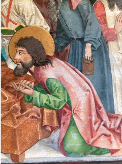
ABB. 23: Auf dem Marienaltar zeichnen sich hinter Margaretha und Katharina die Reste von einst applizierten Sternen ab. Es ist unklar, wann sie verloren gingen und man den Hintergrund flächig grau durchmalte.

illusionistisch gemalten Stoffes war Konrad Witz. Bei einem ihm nahestehenden Nachfolger aus der Zeit um 1445/50 findet sich denn auch ein mögliches Vergleichsbeispiel. 41