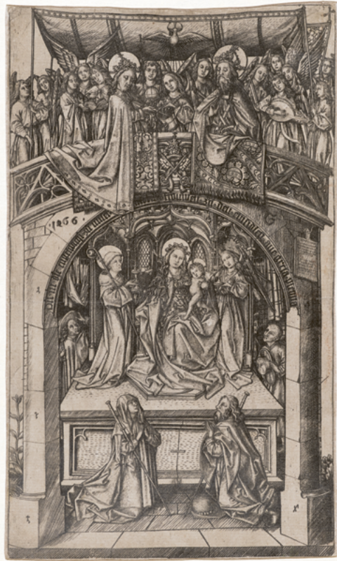
ABB. 26: Kupferstecher ES, Die grosse Madonna von Einsiedeln, datiert 1466. Auch auf dieser Grafik sind die Gewänder in komplizierte Falten gelegt und wirken wie «eingefroren» (Öffentliche Kunstsammlung Basel, Kupferstichkabinett, Inv. Aus K.6.46).