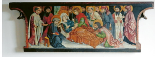
ABB. 1: Festtagsseite des Dreikönigsaltars in der Benediktuskapelle der Kollegiumskirche in Sarnen. Vom ursprünglichen Bestand haben sich nur die gemalten Teile erhalten.

ABB. 2: Vermutlich zierte das in Hermetschwil erhaltene Gemälde mit dem Marientod als Predella einst den Unterbau des Dreikönigsaltars.