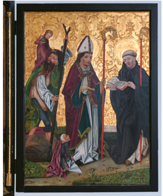
ABB. 12: Dreikönigsaltar: Das Pendant rechts zeigt drei heilige Männer, Christophorus, Martin und – vermutlich – Benedikt von Nursia.

jugendliche Gottesmutter liegt umringt von den zwölf Aposteln auf einem quer ins Bild gestellten Bett. Die Männer erteilen ihr den letzten Segen, beten, trauern oder spenden einander Trost. Eindrücklich sind die individuell – teilweise gar etwas überzeichnet – wiedergegebenen Jünger Christi mit grossen Köpfen und auch von weitem erkennbarer Physiognomie. Die Ikonografie setzt nicht notwendigerweise die Kenntnis des berühmten Kupferstichs von Martin Schongauer voraus, wie dies vermutet wurde. 25 Es ist eher denkbar, dass eine heute unbekannte niederländi-