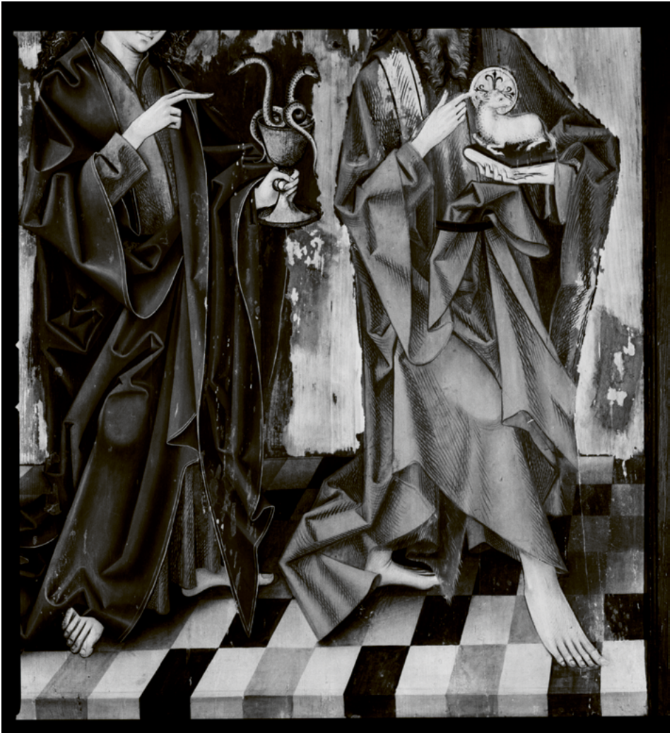
ABB. 24: Infrarotfotografie der Aussenseite des Dreikönigsaltars. Beim violetten Gewand von Johannes dem Täufer rechts ist die sorgfältige Vorbereitung mit schwarzem Pinsel gut zu sehen. Sie ist qualitativ einer selbständigen Zeichnung vergleichbar.