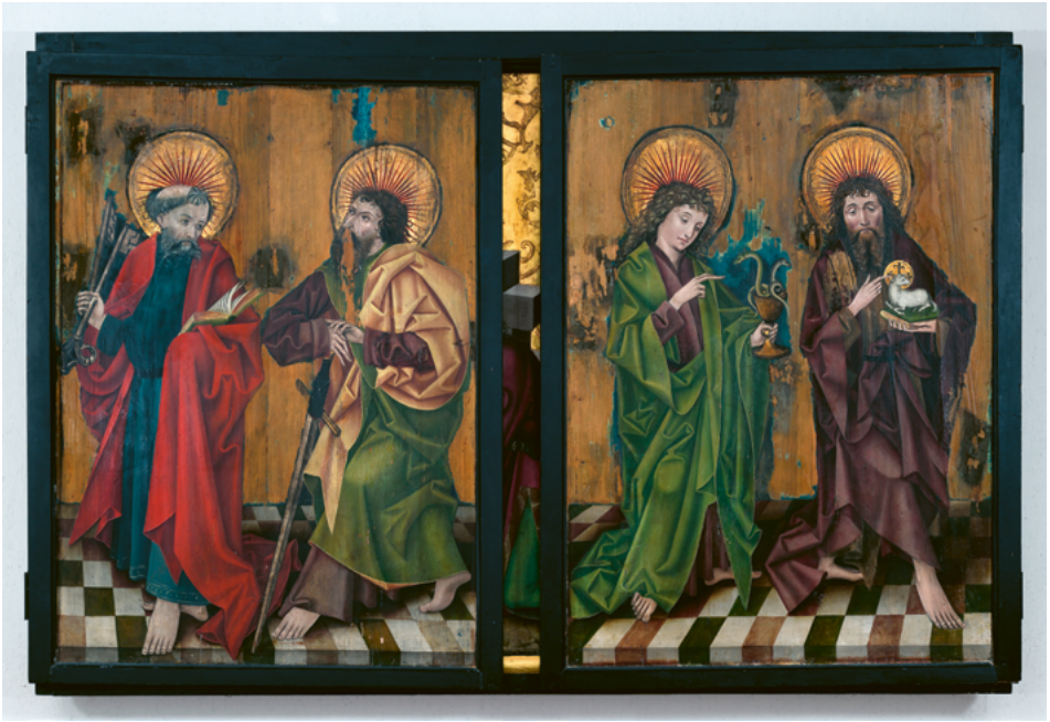
ABB. 3: Auf dem Dreikönigsaltar sind bei geschlossenen Flügeln stehende Heilige dargestellt: Petrus, Paulus, Johannes der Evangelist und Johannes der Täufer.

ABB. 4: Von einem zweiten Altar derselben Werkstatt, hier Marienaltar genannt, haben sich im Benediktinerkollegium in Sarnen die beiden Flügel erhalten. Die goldgrundigen Innenseiten zeigen Marienszenen, hier die Verkündigung der Geburt Christi durch den Erzengel Gabriel.