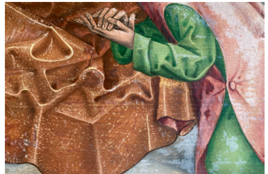
ABB. 19: Der Pressbrokat wurde zur Darstellung von teuren Gewändern angewendet. Die Technik war kompliziert und aufwendig und sagt etwas aus über die Kosten des Auftrages.