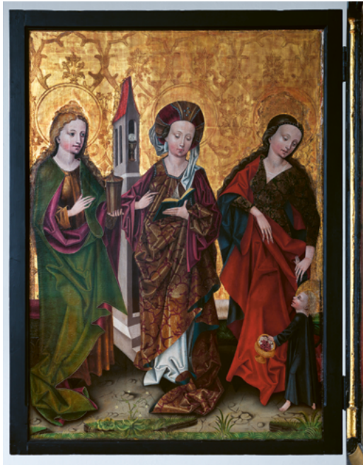
ABB. 11: Dreikönigsaltar: Die drei Frauen stehen vor Goldgrund auf einem natürlichen Bodenstreifen. Besondere Bedeutung verleiht der Maler ihren wunderbaren Gewändern (Foto: Christine Seiler).