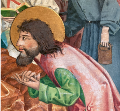
ABB. 33: Kopf des Paulus, Predella Kloster Hermetschwil, Ausschnitt aus Abb. 2.

ABB. 32: Meister ES, Paulus aus der Serie der sitzenden Apostel. (Staatliche Museen zu Berlin, Kupferstichkabinett, Ident.-Nr. 388-1).