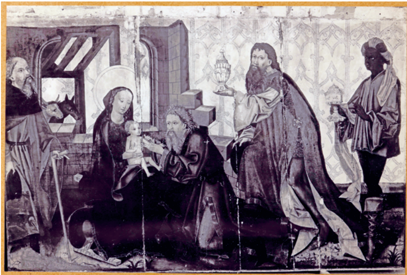
ABB. 15: Zu einem unbekanntem Datum wurden die beiden Flügel des Dreikönigsaltars vertauscht. So sähe die Aussenseite bei richtiger Anordnung der Heiligen aus.