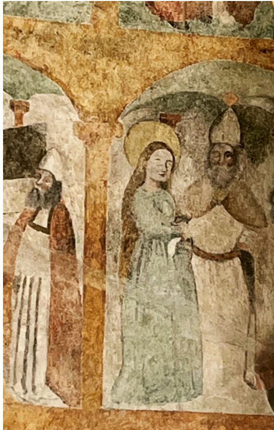
ABB. 37: Die Wandmalereien in der Muttergotteskapelle in Bremgarten stammen von etwa 1460. Aufgrund ihres Erhaltungszustandes sind sie stilistisch nur beschränkt mit den Gemälden in Sarnen zu vergleichen. Ausschnitt des Zyklus zum Marienleben an der Nordwand.

gotteskapelle verantwortlich war (Abb. 37). 86 Die Familienverhältnisse der Malerdynastie sind ungeklärt, doch müssen mehrere Generationen der Tiefentals in der Gegend tätig gewesen sein. So ist ab 1480 die Werkstatt eines Malers Hans Heinrich in Aarau belegt. 87 Wenn die These stimmt, hätte Hans Heinrich in der Werkstatt des überaus berühmten Hans – seines Vaters oder Onkels? – gelernt und dessen Vorlagenschatz geerbt.