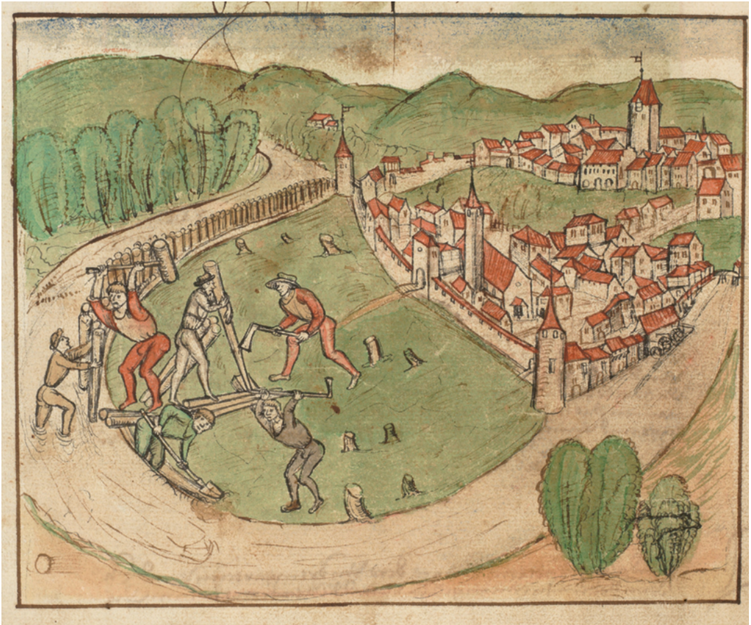
ABB. 39: In der Chronik von Werner Schodoler, um 1514, ist die älteste Ansicht Bremgartens von Westen überliefert. Der repräsentative Amtshof des Klosters Muri in der Oberstadt ist am Stufengiebel vor dem sogenannten Spittelturm zu erkennen (Stadtarchiv Bremgarten, Bücherarchiv Nr. 2, Werner Schodoler, Eidgenössische Chronik, Bd. 2, fol. 65v, www.e-codices.ch ).