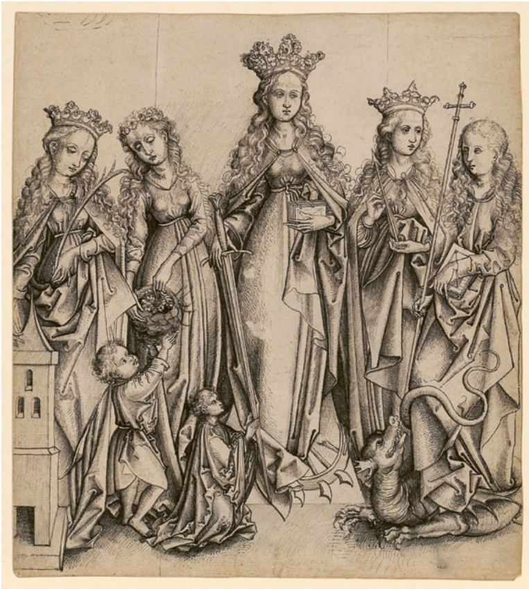
ABB. 36: Die Jungfrauen auf einer Zeichnung aus dem Umfeld Martin Schongauers, um 1470/80, im Kupferstichkabinett Basel, gleichen in vielerlei Hinsicht den beiden Heiligen auf dem Marienaltar (Öffentliche Kunstsammlung Basel, Kupferstichkabinett, Inv. U.XVI.6).

Kupferstiche noch nicht, doch zeigt eine Zeichnung aus seinem Umfeld grosse Ähnlichkeiten (Abb. 36). 75 Unter den fünf wie in Sarnen zumeist gekrönten Heiligen sind teilweise dieselben Frauen vertreten, doch scheint ihre Identifikation eher zufällig, gleichen sie sich doch untereinander weitgehend. Wieder ist anzunehmen, dass dem Sarner Maler und dem oberrheinischen Zeichner sehr verwandte oder gar identische Vorlagen zur Verfügung standen.