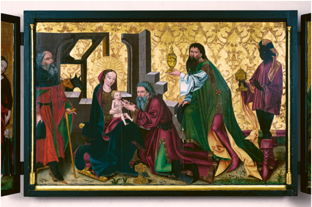
ABB. 8: Die Anbetung des Kindes durch die drei Könige, hier sind es drei Weise, bildet das Thema des Mittelbildes des Dreikönigsaltars. Der Maler folgt in seiner Darstellung berühmten Vorbildern (Foto: Christine Seiler).

Ein weiteres Merkmal des Dreikönigsaltars in Sarnen stimmt wieder eher mit Stefan Lochners Komposition überein. Während nämlich Rogier van der Weyden auf den beiden Innenflügeln zwei vom Mittelbild unabhängige Szenen zeigt, ist auf dem Altar der Kölner Stadtpatrone der Bodenstreifen auf den Retabelflügeln weitergeführt und dient als Bühne für vor goldenem Grund stehende Heilige. So auch in Sarnen: Indem auf dem Gemälde der Raum der Mitteltafel als ein natürlicher, bewachsener Boden gestaltet ist, der auf gleicher Höhe auf die beiden Seitenbilder ausgreift, nehmen wie bei Lochner die dargestellten Heiligen auf symbolische Weise an der Anbetung der Mitteltafel teil (Abb. 1). In Sarnen sind dies im heutigen Zustand links drei heilige Jungfrauen: Magdalena mit Salbgefäß, Barbara mit Buch vor einem Turm und Dorothea, die sich einem Kind mit Blütenkorb – dem Christkind – zuwendet und es liebevoll bei der Hand nimmt (Abb. 11). Rechts bezeugen drei männliche Heilige den Moment der Huldigung (Abb. 12): zunächst der