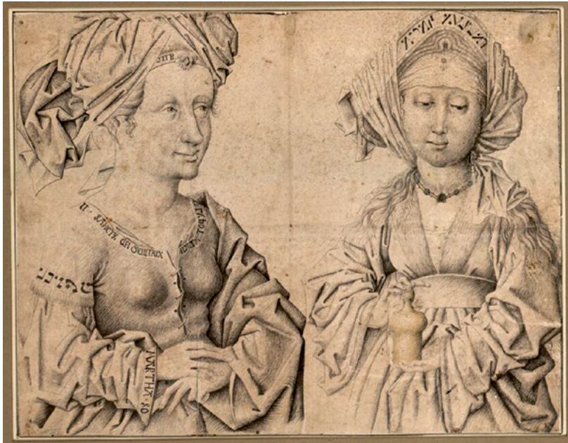
ABB. 35: Die Kleider auf dem Dreikönigsaltar entsprechen der niederländischen Mode im mittleren 15. Jahrhundert. Die Zeichnung der beiden Jungfrauen, um 1460, kopiert solche Vorbilder (Wien, Grafische Sammlung Albertina, Inv.-Nr. 3046).

nung der Zeit um 1460/70, die sich in Wien erhalten hat (Abb. 35). 73 Es soll sich um eine Nachzeichnung eines Werkes aus dem Umkreis von Rogier van der Weyden handeln. 74 Nur in den seltensten Fällen haben sich solch fragile Zeugen der Vermittlung – also etwa Musterbücher der wandernden Maler in Ausbildung – erhalten. Man darf aber davon ausgehen, dass sie wertvoller und sorgfältig gehüteter Teil jeder mittelalterlichen Werkstatt waren.