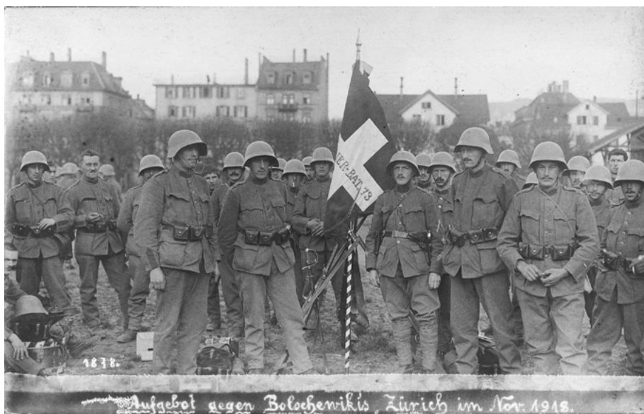
Abb. 7: «An den Bataillonen des Landvolkes ist die Revolution zerschellt»: Die Retterrolle des Militärs war im bürgerlichen Erinnerungsdiskurs Konsens.

Schweiz vor der vermeintlichen Revolution den grössten Beitrag geleistet zu haben. 1218 Rasch entstand im Lager der Sieger ein Deutungsmuster, das nachfolgend als Rettungsthese bezeichnet wird. An den Beispielen des bäuerlichen und katholischen Milieus sowie der lateinischen Schweiz wird gezeigt, wie sich einzelne bürgerliche Akteursgruppen um öffentlich-mediale Anerkennung bewarben. Dass bestimmte Milieus über ihren Einsatz im Landesstreik eine gesellschaftspolitische Aufwertung erfuhren, beeinflusste die politische Kultur der Schweiz in der Zwischenkriegszeit entscheidend. Welche politischen Ansprüche daraus abgeleitet wurden und welche Folgen dies nach sich zog, wird im Anschluss gesondert betrachtet.