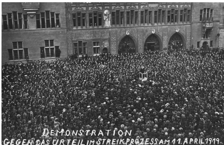
Abb. 10: Die Urteile im Landesstreikprozess wurden von weiten Teilen der Linken als «Klassenjustiz» der «Bourgeoisie» angeprangert.