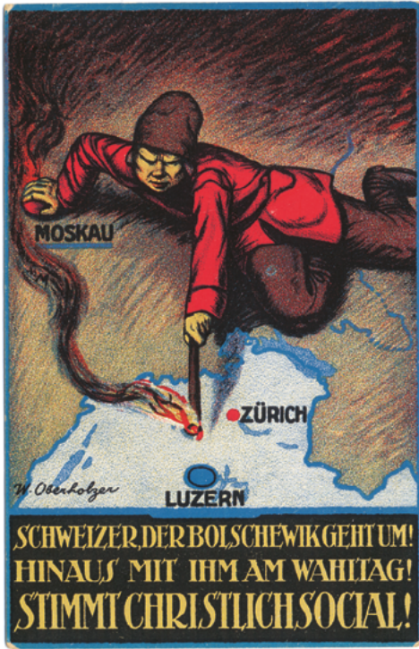
Abb. 2 & 3: Das Motiv des bolschewistischen Brandstifters als Wahlkampfmittel der Luzerner Christlichsozialen, 1919 (Vor- und Rückseite).