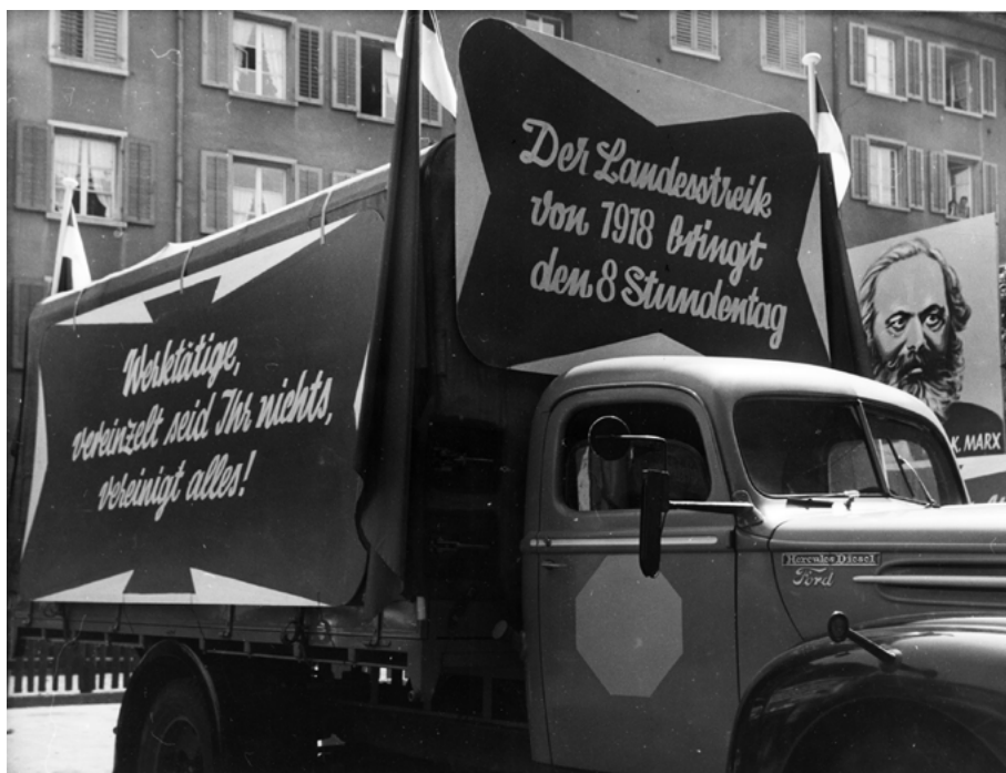
Abb. 8: An der Zürcher Maifeier von 1951 wurde im Sinne der Erfolgsthese an den Landesstreik erinnert. (Sozialarchiv, Signatur: F 5047-Fb-142)

Erfolgsthese – eignet sich dabei ein Blick auf das Ende des Untersuchungszeitraums. Ein Blick auf die sozialdemokratisch-gewerkschaftlichen Publikationen zum 50-Jahr-Jubiläum des Landesstreiks von 1968 zeigt hinsichtlich des Ergebnisses ein eindeutiges Stimmungsbild. Die überlieferten Quellen transportieren eine Deutung, die der Historiker Christian Koller 2018 als «Interpretation des Landesstreiks als Initialzündung des sozialen Fortschritts» bezeichnet hat. 1331 Der Landesstreik wurde in der Rückschau entsprechend als grosser Erfolg der Arbeiterbewegung und als Ausgangspunkt sozialstaatlicher Errungenschaften gefeiert. Die Rede war von einem zunächst verloren geglaubten Kampf, der langfristig dennoch Früchte getragen habe. Anlässlich einer Gedenkfeier des SGB wurde die Konfrontation von 1918 folglich mit einer «Durchbruchsschlacht» von historischem Ausmass verglichen. 1332 Der SGB-Funktionär Eugen Hug verdeutlichte diese Position, indem er feststellte, «dass auch eine Niederlage positive Folgen zeitigen» könne. Rückblickend sei der Landesstreik «als ein Wendepunkt zu betrachten», der «freilich nicht sofort, sondern erst in jahrzehntelangem Nachwirken» das soziale Bewusstsein