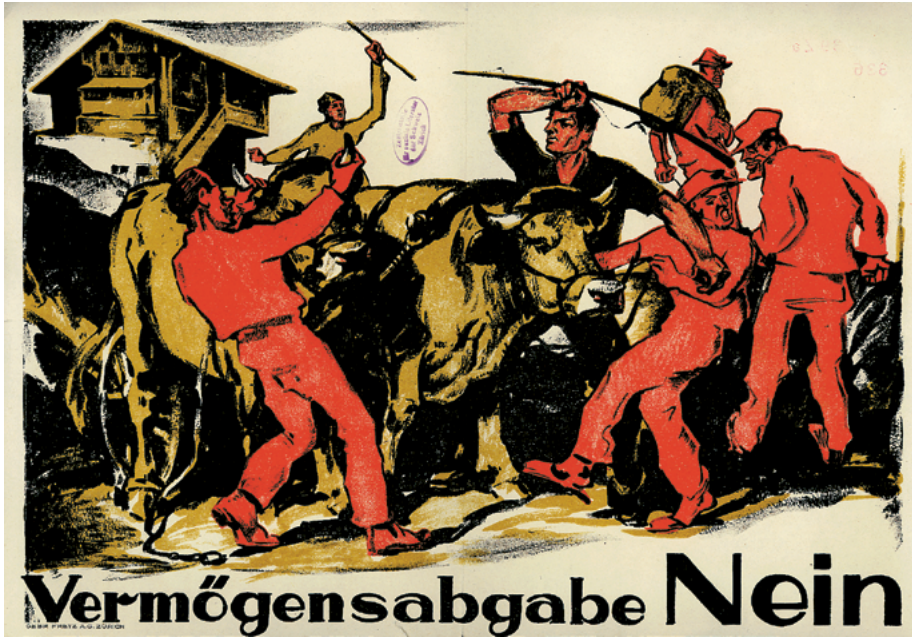
Abb. 5: Die Dystopie einer proletarischen Diktatur und insbesondere Enteignungsängste zeigten sich auch in bürgerlichen Wahlkampfplakaten.