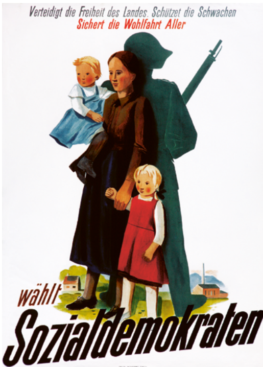
Abb. 6: Mit der ideologischen Neuorientierung im Kampf für die Demokratie und gegen den Faschismus ab 1933 rückte auch der Antimilitarismus zunehmend in den Hintergrund.