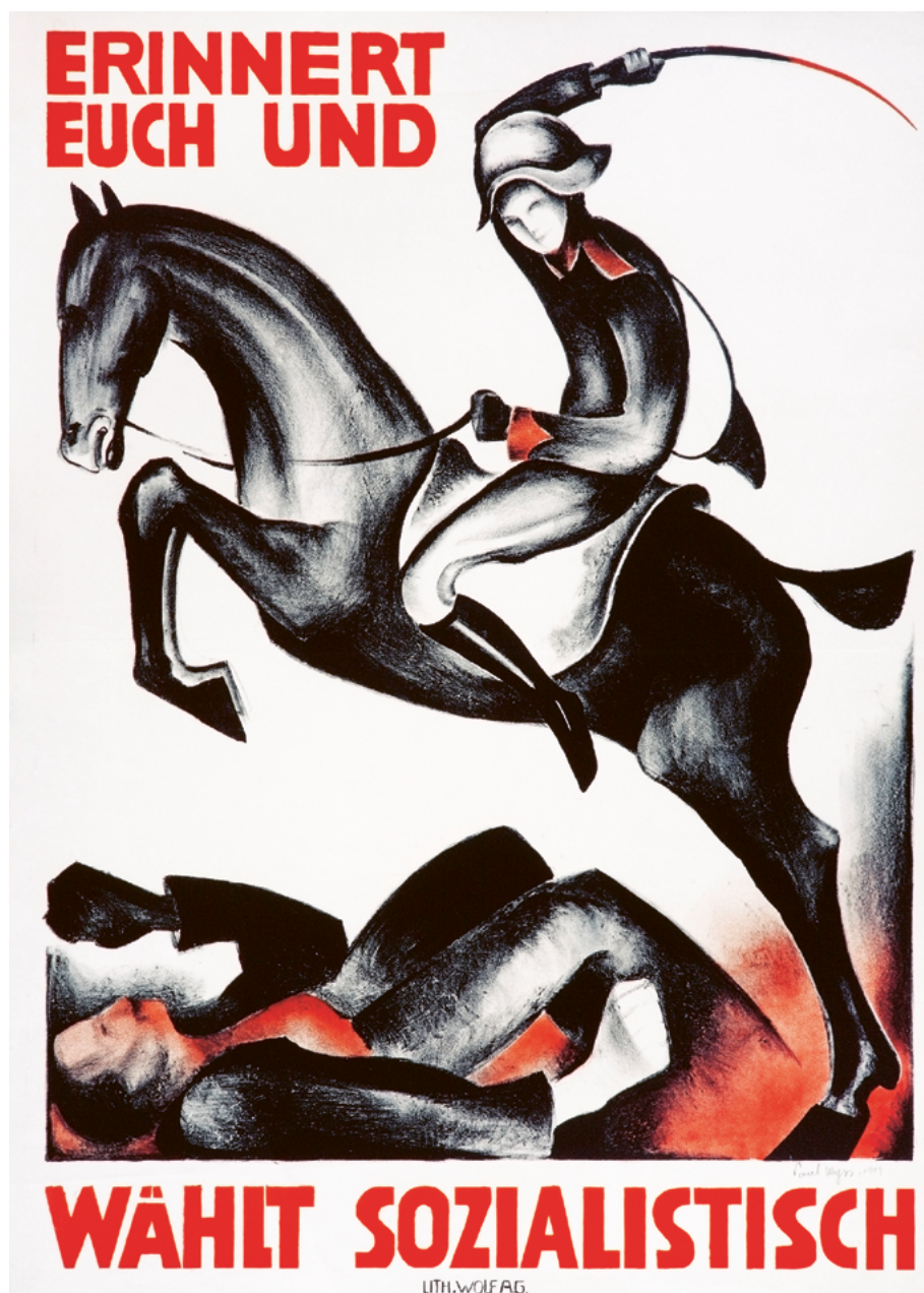
Abb. 4: Offene Wunden: Anlässlich der Parlamentswahlen von 1919 warb die SP mit der Opferthese um Wählerstimmen.