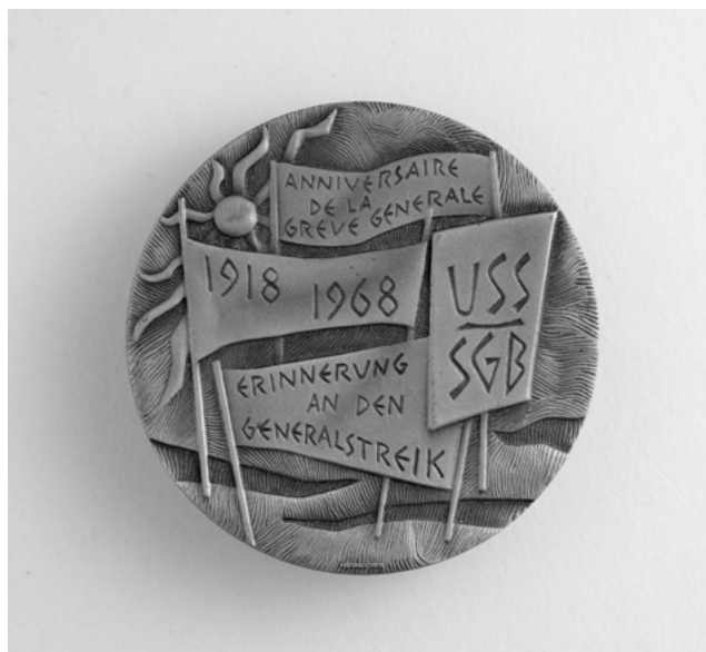
Abb. 9: Anlässlich des 50. Landesstreikjubiläums wurde der zeitweilig verdrängte Landesstreik vom SGB als Erfolgsgeschichte gefeiert. (Sozialarchiv, Signatur: F 5068-Oa-0426)

tische Position gewichtet die reaktionären und repressiven Nachwirkungen des Landesstreiks, die sich vor allem in den 1920er- und frühen 1930er-Jahren zeigten, höher, als die sozialpolitischen Impulse, die besonders 1918/19 und im Zweiten Weltkrieg zu greifbaren Reformen führten. Martin Fenner wiederum sprach von einem «sozialdemokratische[n] Credo», wonach der Landesstreik «trotz der Kapitulation nicht umsonst gewesen sei», und stellte einen Kausalzusammenhang zwischen 1918 und 1948 grundsätzlich in Frage. 1341 Nachfolgend wird deutlich, dass indirekte politische Nachwirkungen des Landesstreiks bis in die Zeit des Zweiten Weltkriegs und die unmittelbare Nachkriegszeit nicht von der Hand gewiesen werden können. 1342