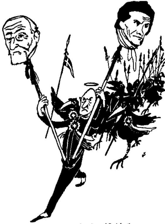
Etter «ehrt» Spitteler und Pestalozzi!

Heiri Strub: Etter «ehrt» Spitteler und Pestalozzi. In: Vorwärts, Nr. 61, 14. 3. 1946.